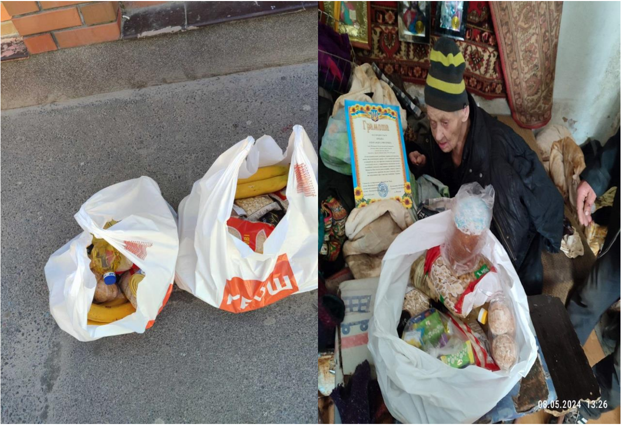
Налагоджено взаємодію з поліцейськими громади на виборчому окрузі